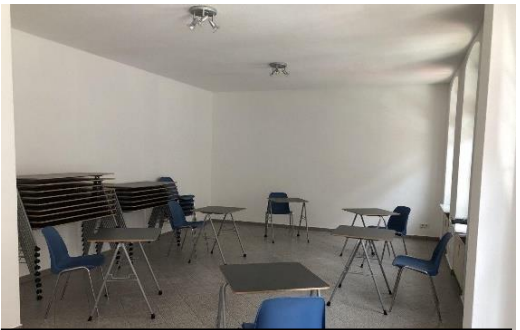
Unser Büro in Chemnitz ähnlich wie in Leipzig mit nur 5 Gästen

werden wir ab jetzt sonntäglich um 15h00 einen Gottesdienst in Farsi halten. Wir werden ab dann auch nicht mehr in der Kreherstr. 93 untergebracht sein. Ab Mitte des Monats Juli auch an jedem Samstag (ganzer Tag) mit Unterricht und sozialen Hilfen zur Verfügung stehen. Diese Programme werden in dem neuen Büro, das nur knapp 500m von der Kirche entfernt ist, angeboten. Das neue Büro ist in der Hainstr. 81, 09130 Chemnitz.