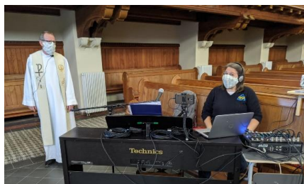
Livestream Gottesdienste in Leipzig mit besonderen Maßnahmen

In Leipzig herrscht im Moment Urlaubsstimmung. Wir haben einen herrlichen Frühsommer und die ersten Lockerungsmaßnahmen sorgen dafür, dass sich gute Laune verbreitet.