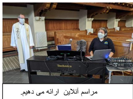
مراسم آنلاین ارائه می دهیم.

میهمانان ما فقط مجاز با ماسک صورت و پس از ضدعفونی کردن دستانشان وارد میشوند. علاوه بر این، ما فقط اجازه ورود حداکثر 5 نفر را می دهیم. تقریباً تمام برنامه هایی که بسیاری از شرکت کنندگان