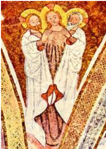
تصویر کشیده شده از سه خدای یگانه توسط اولین مسیحیان

از طرفی دیگر این اشتباه امکان دارد پیش بیاید که انسان بگوید که خدای پدر و خدای پسر و روح القدس در یک شخص خلاصه و آمیخته شده اند و فقط یک شخص وجود دارد. و در این حالت خدای پدر یکبار به عنوان خودش و یک بار به عنوان خدای پسر و یک بار هم به عنوان روح القدس تشخیص داده می شود. انجیل حتی در عهد جدید این را تأکید کرده است که فقط یک خدا وجود دارد. ولی در جای دیگری هم گفته است که عیسی و روح القدس هم خدا می باشند. که همه اینها در جایگاه خودشان خداوند هستند و خواست و اهدافشان یکی می باشد.